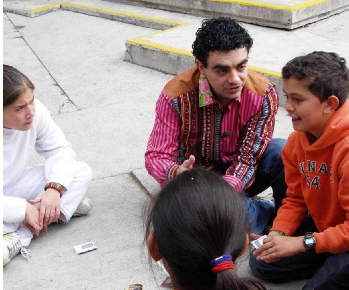
Im Gespräch mit Schülern: Rolando Villazón, Opernsänger und Absolvent der Deutschen Schule Mexiko-Stadt

Durch das Pädagogische Qualitätsmanagement wird das Markenzeichen „Deutsche Auslandsschule“ zukünftig noch größere Anerkennung genießen. Dieses heißt aber auch, dass nur solche Schulen zu diesem Kreis gehören können, die dem Qualitätsverständnis für Deutsche Auslandsschulen entsprechen und ein deutsches Schulziel (z.B. Mittlere Bildungsabschlüsse, Abitur und berufliche Qualifikationen) und ein entsprechendes deutschsprachiges Unterrichtsprogramm anbieten.